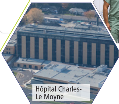
Hôpital Charles-Le Moyne