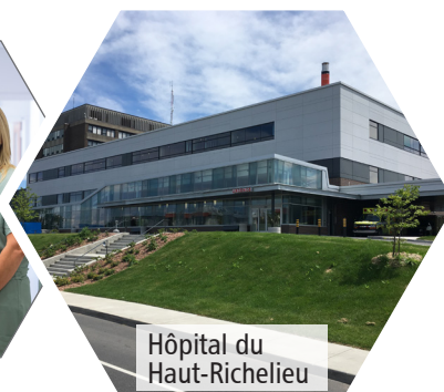
Hôpital du Haut-Richelieu

Centre intégré de santé et de services sociaux de la Montérégie-Centre